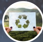
MACHINE DE RECYCLAGE