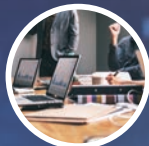
ESPACIO DE TRABAJO