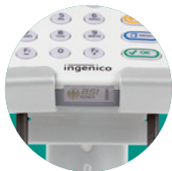
Überprüfung der Gehäuse- und Slot-Siegel problemlos möglich, ohne das Terminal aus der Halterung zu nehmen.