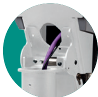
Unauffällige und geschützte Kabelführung vom Terminal durch die Halterung