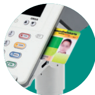
Alle Kartenslots sind einfach und komfortabel zugänglich.