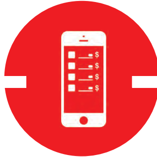
App & API/SDK