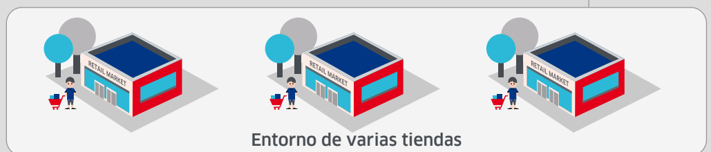
Entorno de varias tiendas