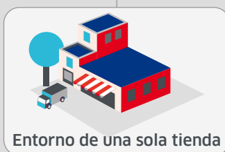
Entorno de una sola tienda