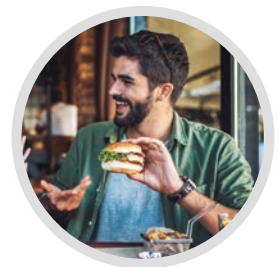
FOOD & BEVERAGE