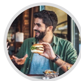
FOOD & BEVERAGE